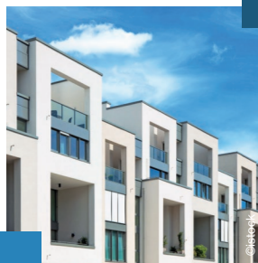
1 Eine der Immobilien wurde bereits erfolgreich veräußert.